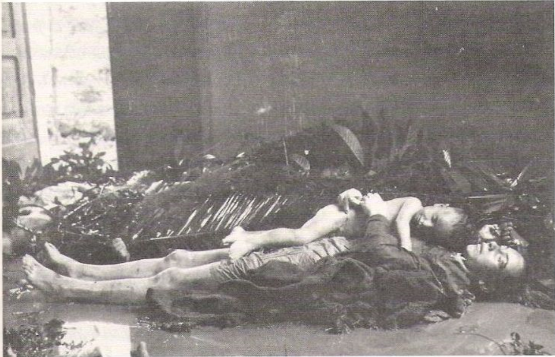
Vittime del disastro.