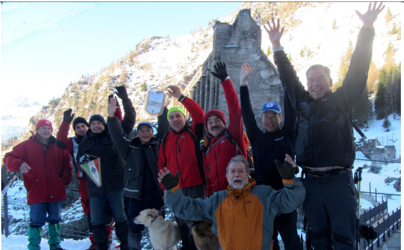
01.12.2013. Un Ola Mondiale con i Radioamatori in collegamento con la Prefettura di Bergamo e di New York ed i colleghi del Vajont e con ..Qualcuno più in alto.. per non dimenticare