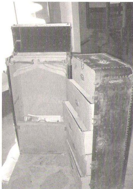
Esemplare di baule utilizzato dagli emigranti, esposto al Museo Etnografico di Schilpario, donato dai figli di Olimpia Bianchi.