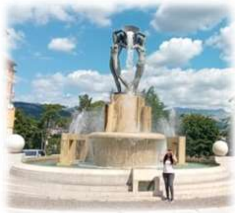
L'Aquila. La Fontana Luminosa