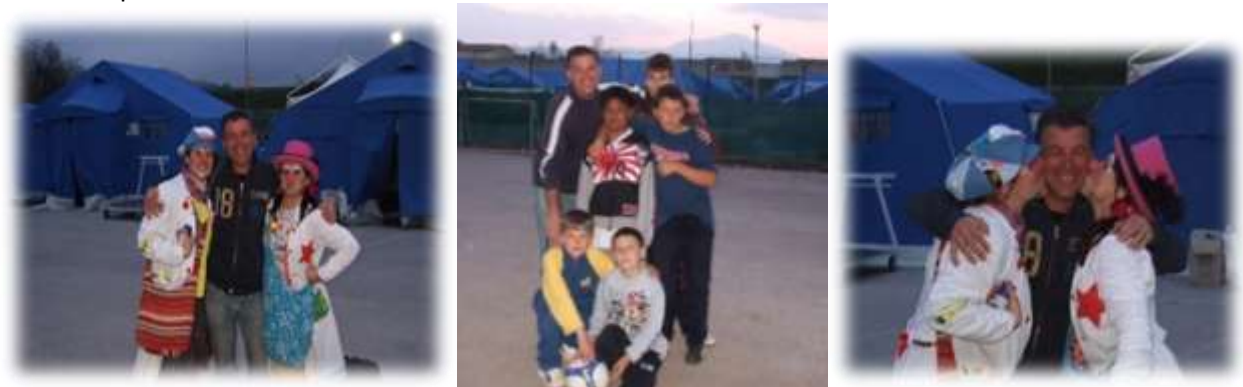
A volte ci recavo al Campo Comunale ...io a giocare a pallone mentre le ns volontarie portavano "riso"