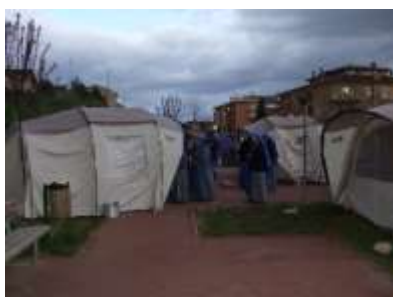
1. Campo Centrale Operativa Suore