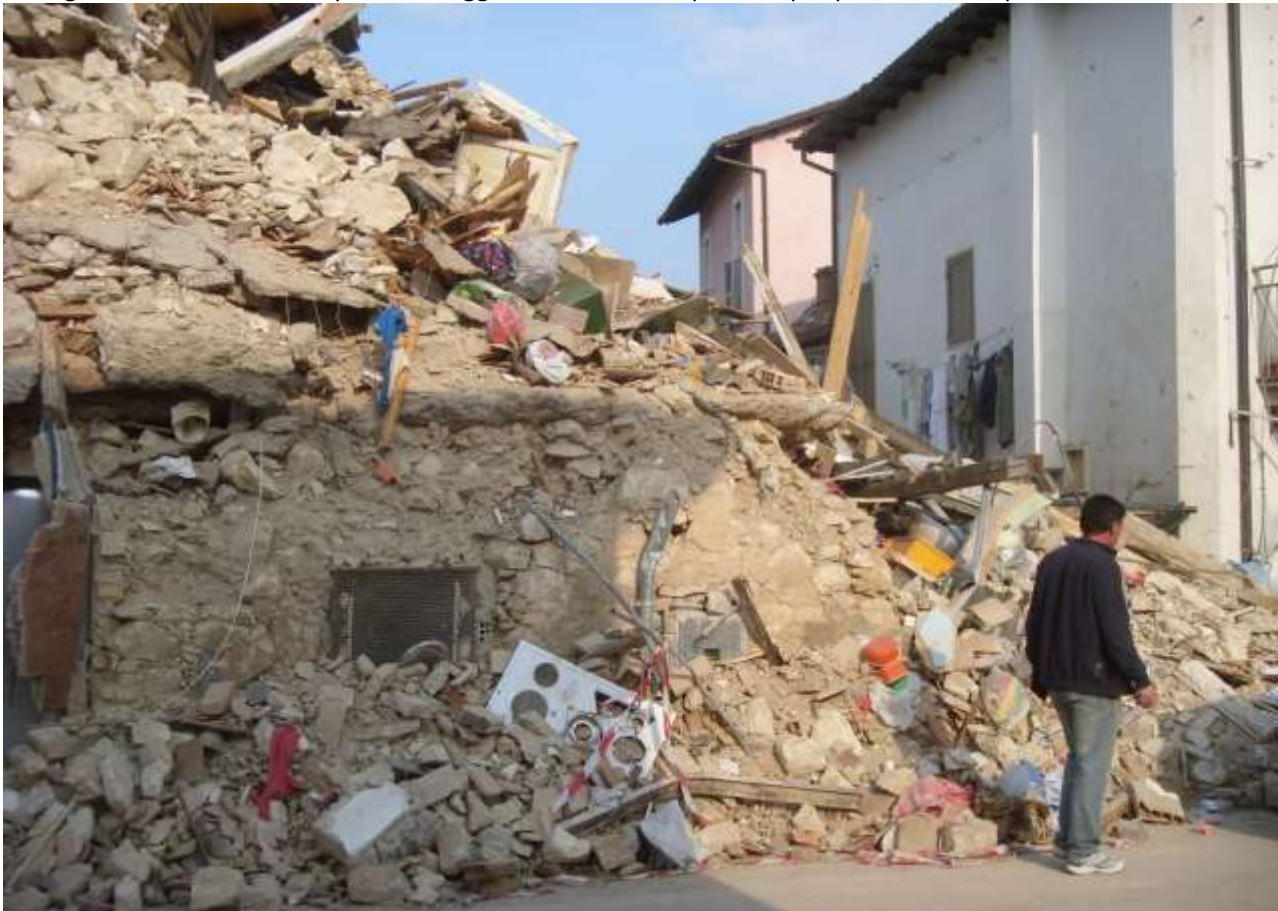
Pure qui.. Ovunque macerie