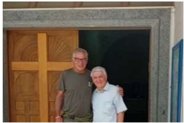
Pettino. Don Dante a lato la Fontana Luminosa

https://semisottolapietra.wordpress.com/2019/10/28/nicola-dantino-e-la-sua-fontana-luminosa/