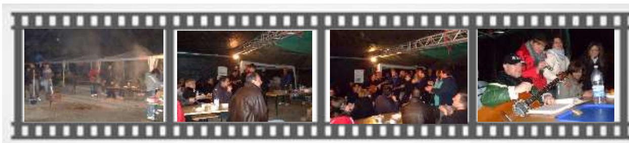
La sera dopo cena sotto il tendone Mensa non mancava mai il Canto