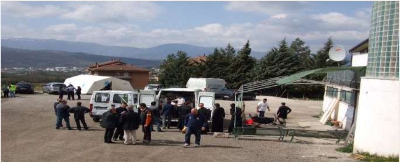
Insediamiento Caritas a Spettino