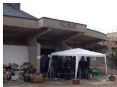
2. Ingresso Dispensario