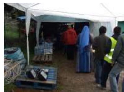
3. La nostra Mensa