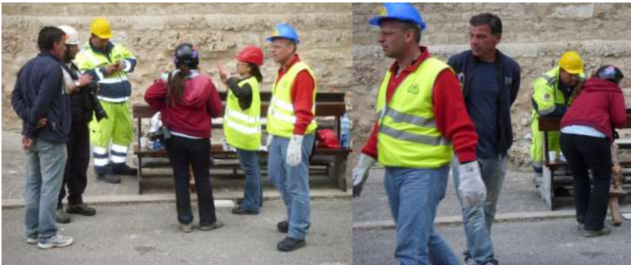
Nella giorno di feria alfine dopo Collemaggio mi reco al Camposanto per porre 1 fiore e poi Onna ..altro disastro