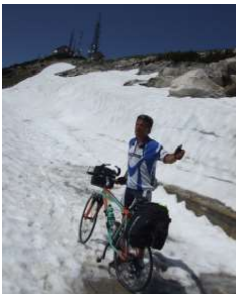
A lato la Cima Blockhaus m2134m Sotto Camposanto San Giuliano in Puglia