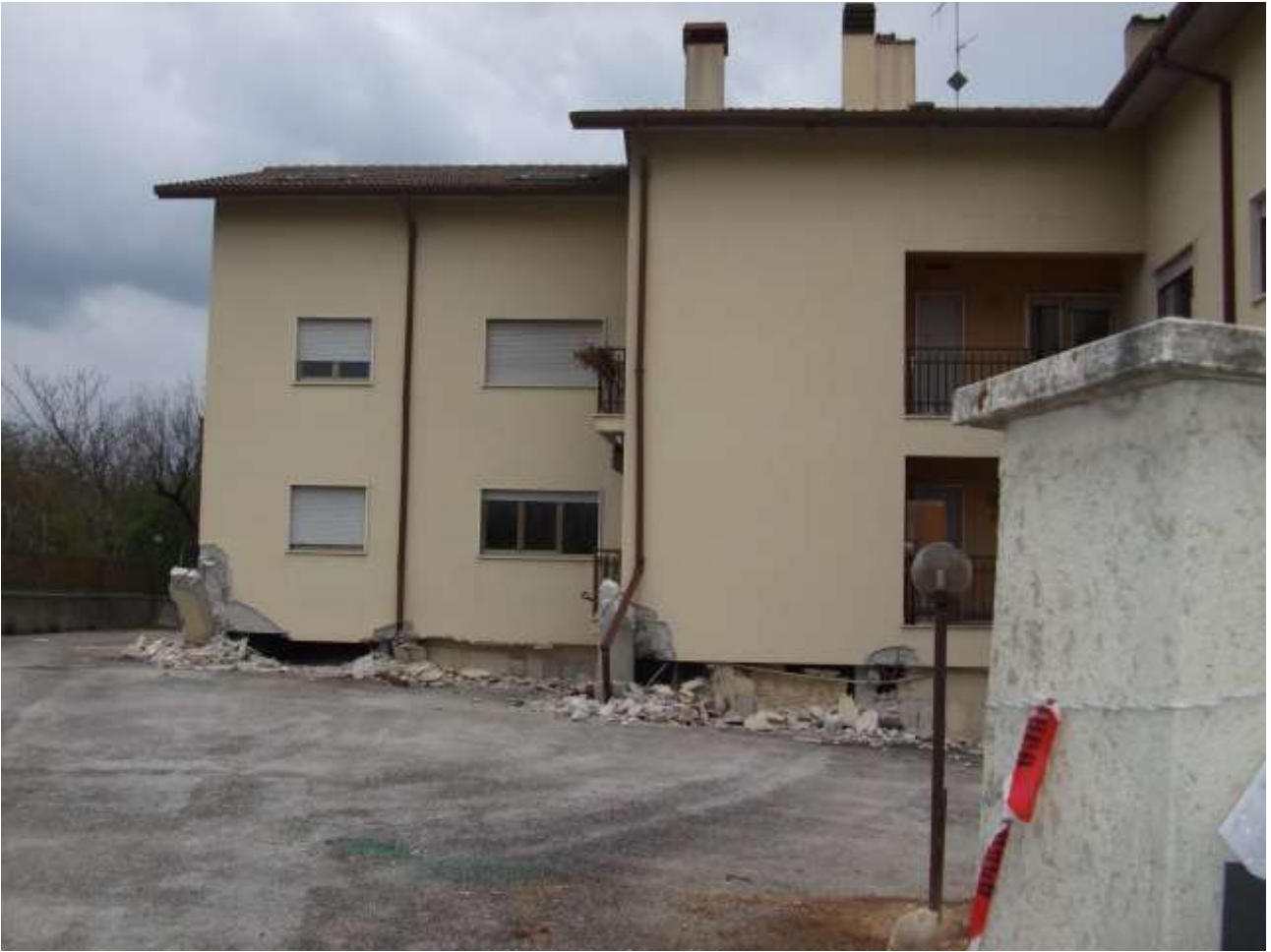
Sabbia (marina) cemento e armature non idonee.. ?