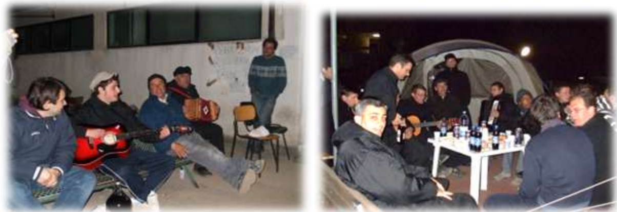
Appoggiato al muro il Giovane Professore, grazie a lui ho conosciuto diverse realtà locali Inverosimile scoprire che neppure mi ricordo il suo Nome di certo mi rimarrà impresso nella mente come la volontaria che curava animali