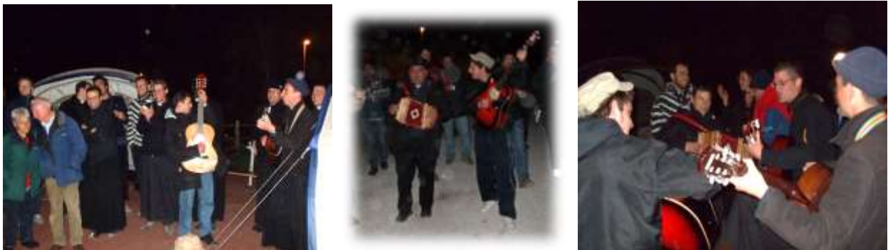
Il Nostro Campo era davvero speciale formato e organizzato perlopiù da Residenti e Volontari Preti Suore e una decina di Boy scout... capitava spesso che la sera portassimo musica e canti nei Campi vicini