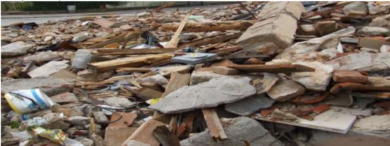
Già che siamo in..ballo tra le varie scosse di assestamento..dopo Onna visitiamo la periferia della Città mentre il Centro Città dell'Aquila rimarrà chiuso addirittura per anni a seguir