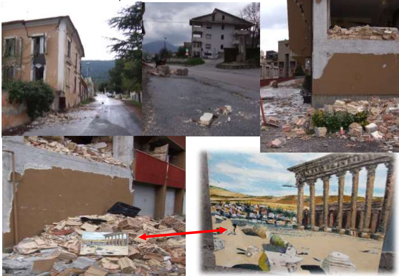
Tra le Macerie 1Quadro delle Rovine trapassate

Quando mi sveglio mi rendo conto che non è solo un sogno semmai incubo.. ... attorno alla Parrocchia..ovunque macerie..