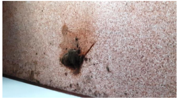
2. Solo 1 Topo nella camera da letto..mi da il benvenuto