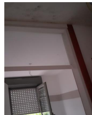
4. Attorno al soffitto del bagno c'è muffa chiaro segnale di qualche perdita delle tubazioni del Signor Inquilino sovrastante ma che tuttora celato non risponde neppure al citofono.. eppure esiste credetemi solo che lo si sente solo di notte..perdonatemi il gioco di parole