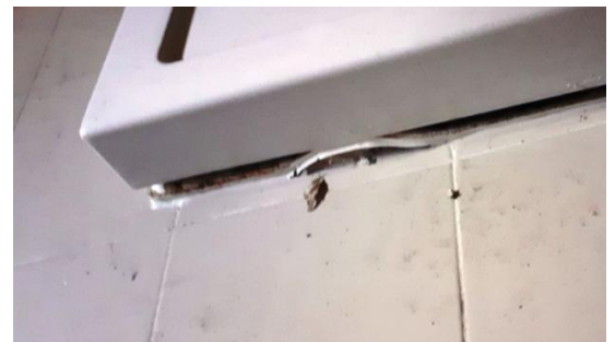
5. Il piano doccia è completamente sollevato..nel frattempo saggio 1 doccia fredda